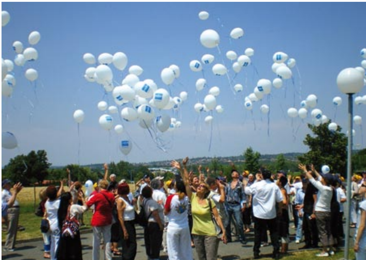
Lâcher de ballons Prémalliance lors du village Bien-Être (Balma 2009)