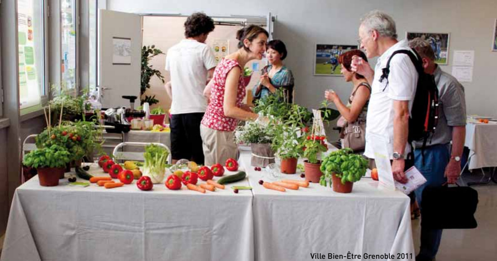
Ville Bien-Être Grenoble 2011