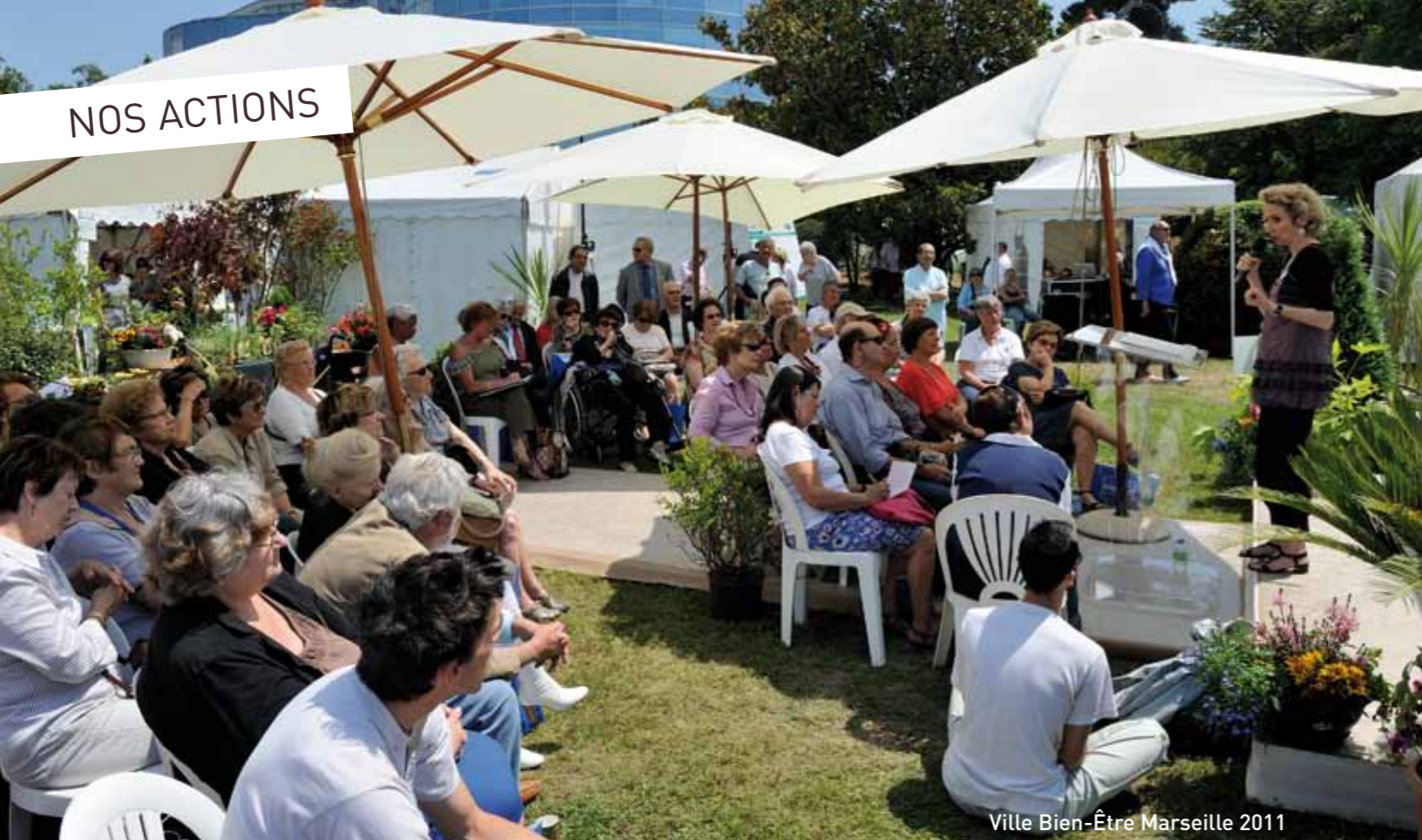
Ville Bien-Être Marseille 2011